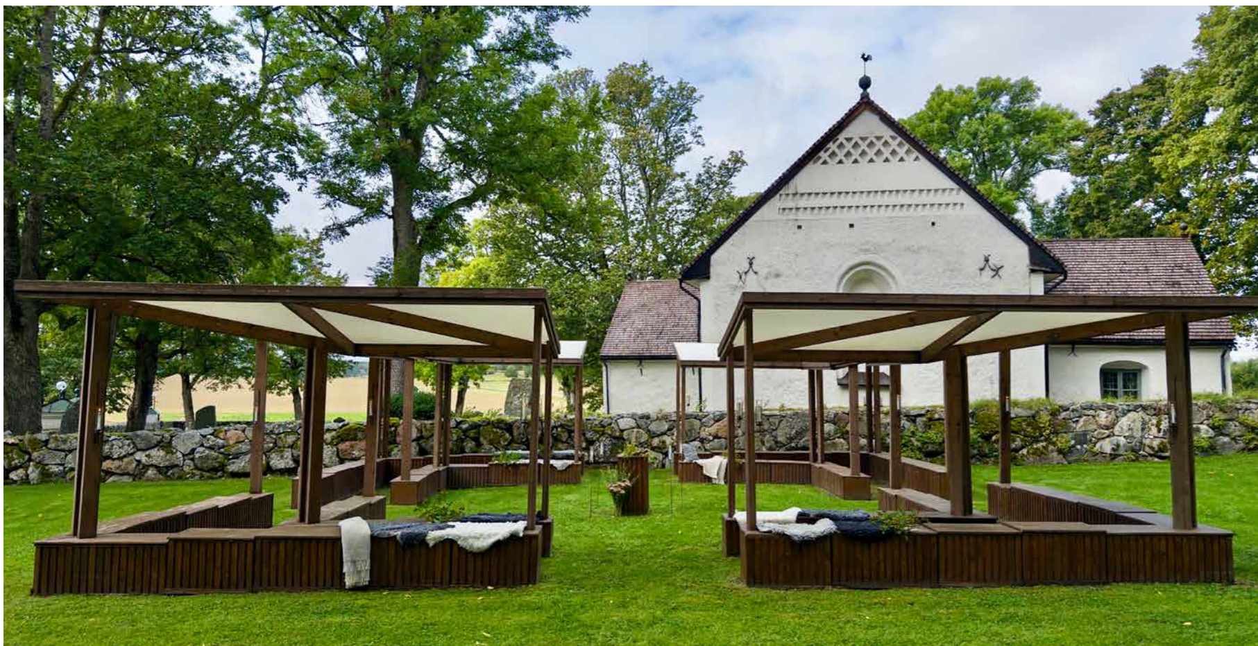
Kapellet Andrum vid Fröslunda kyrka i Örsundsbro.