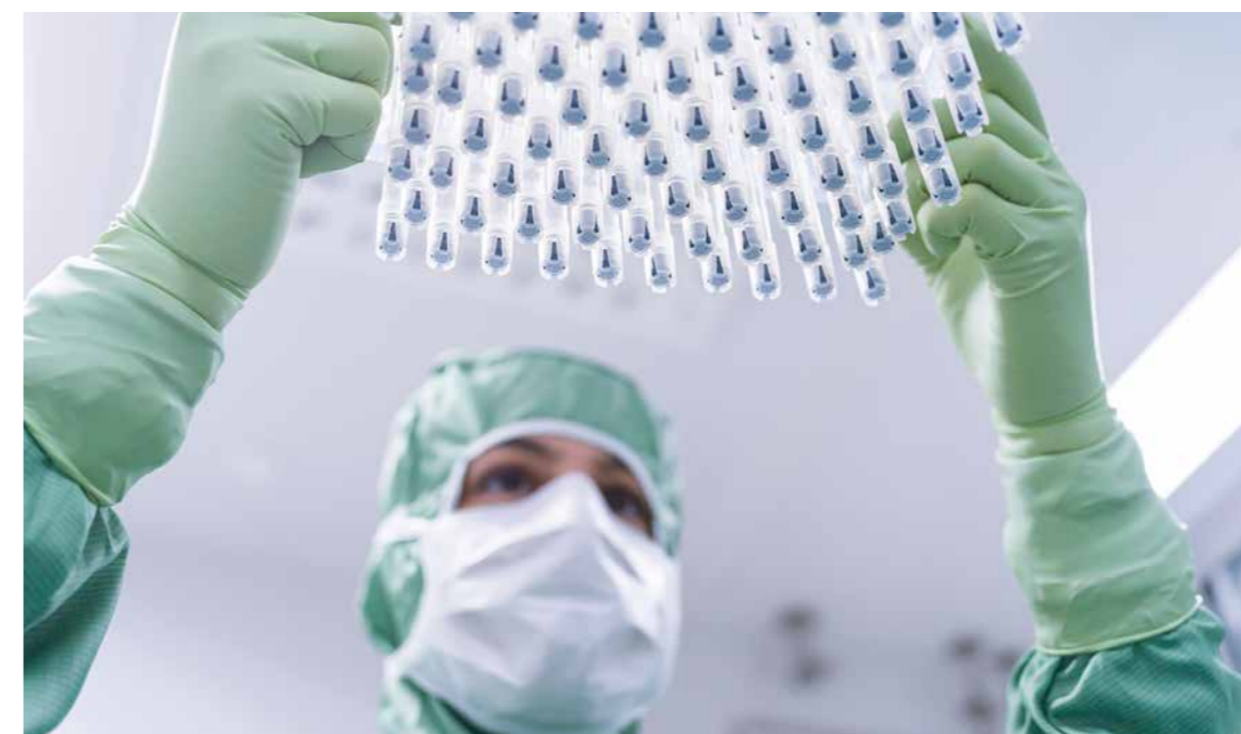
Galdermas verksamhet i Uppsala växer så det knakar. Nu tas jättekälv mot framtiden.