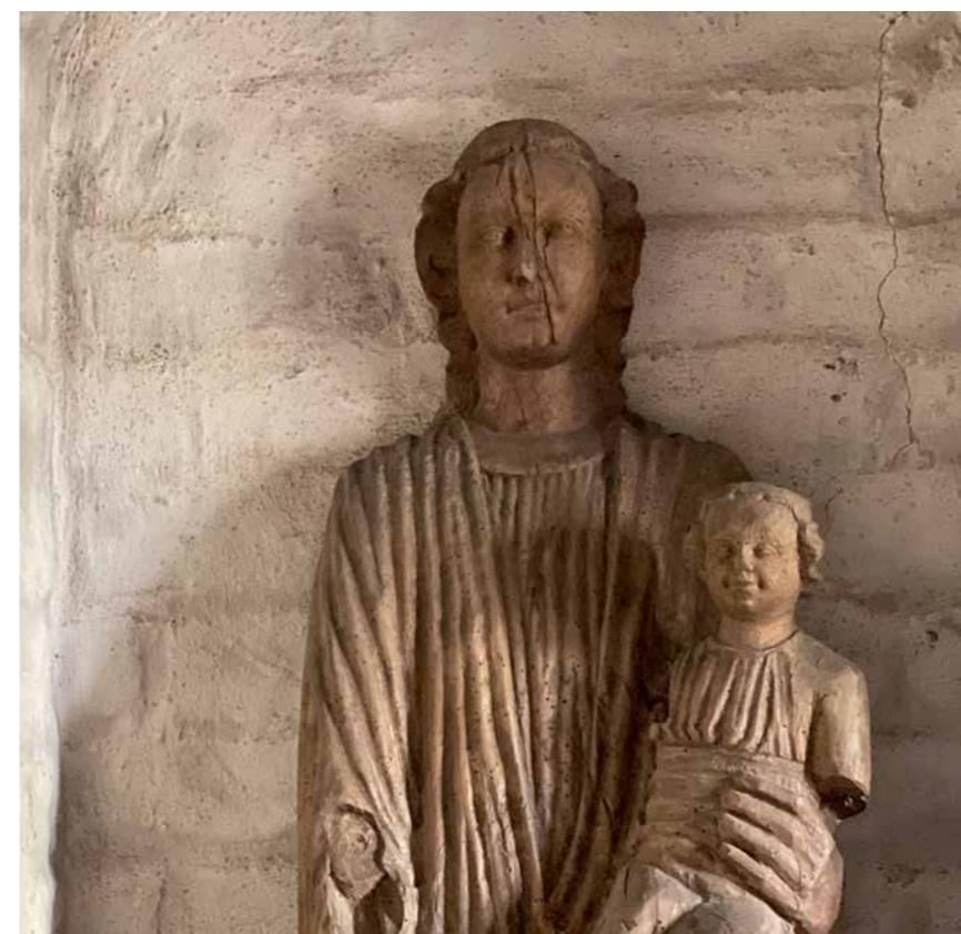
Tronskulpturen i Fröslunda kyrka i Lagunda församling är tillverkad under 1200-talets början i Rhenlandet.

”När vi besöker Andrum, blir vi lite mer levande, dynamiska och innovativa. Vi hittar kreativa vägar ur svårigheter. Vi fördjupas i vår tro.”