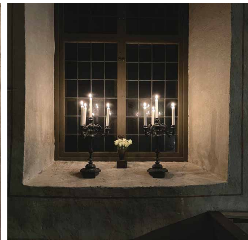
Kandelabern i fönstret i Gryta.